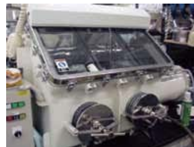
グローブボックス(キャパシタの製作・評価用)

電気二重層キャパシタの研究では、炭素材料科学と電気化学の両方の視点に立った幅広い知識、高度な技術、豊富な経験が必須です。当研究室は、それが可能である国際的にも特徴ある研究室の一つです。最近では、窒素ドープ活性炭によって電気二重層キャパシタの高電圧充電に対する耐久性を大幅に