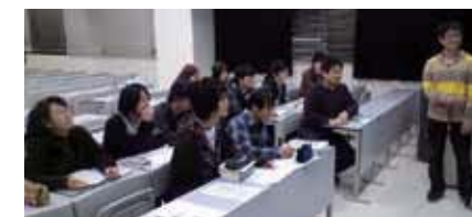
研究室の雑誌会(ゼミ)の様子

当研究室のその他の研究例としては、炭素同素体カルビンの合成とその電気化学的応用が挙げられます。カルビンは、炭素原子が一次元に鎖状に結合した同素体であり、極めて不安定な性質からその大量合成も物性測定も十分になされていない幻の炭素材料です。当研究室では、部分的ながらもカルビン構造を有する炭素電極を合成し、リチウムイオン電池の負極として評価したところ、従来の黒鉛負極と比較して約3倍の容量があることを見出しました。炭素材料にはまだまだ未知の可能性が 있습니다。今後も、炭素材料電極化学をさらに極めることで、キャパシタ・電池といったアプリケーションを通して、エコ社会の実現に貢献します。