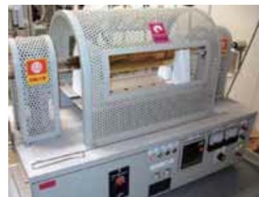
ロータリーキルン炉(活性炭の製造装置)

当研究室では、電気二重層キャパシタを更に高性能化させるため、種々の炭素細孔体電極の製造設備と分析装置を駆使して、研究開発を行っています。